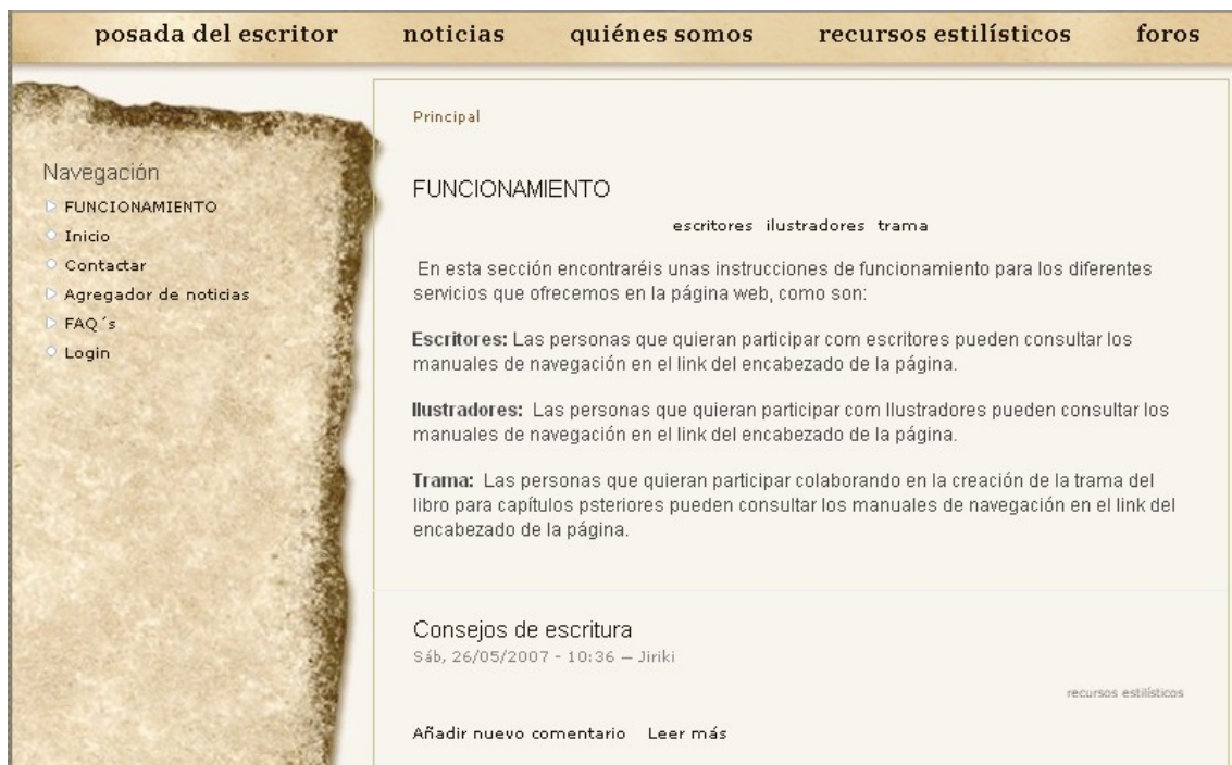
fig. 1: Página de inicio

En la página de United Minds, aparece en la zona superior (fig. 1), los menús para acceder a la zona de colaboración en las tramas.