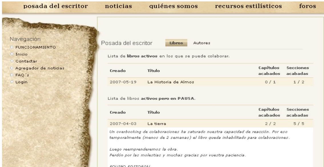
fig. 2: Libros abiertos

Se puede observar (fig. 2), los libros que están abiertos son: La Historia de Almos y La tierra . Nosotros vamos a seleccionar el primer libro para poder colaborar en la sugerencias de las tramas, para ello, tenemos que situar el ratón sobre el título del libro y accionar el botón izquierdo del ratón, de esta forma pasamos a la página que nos sitúa dentro del libro (fig. 3).