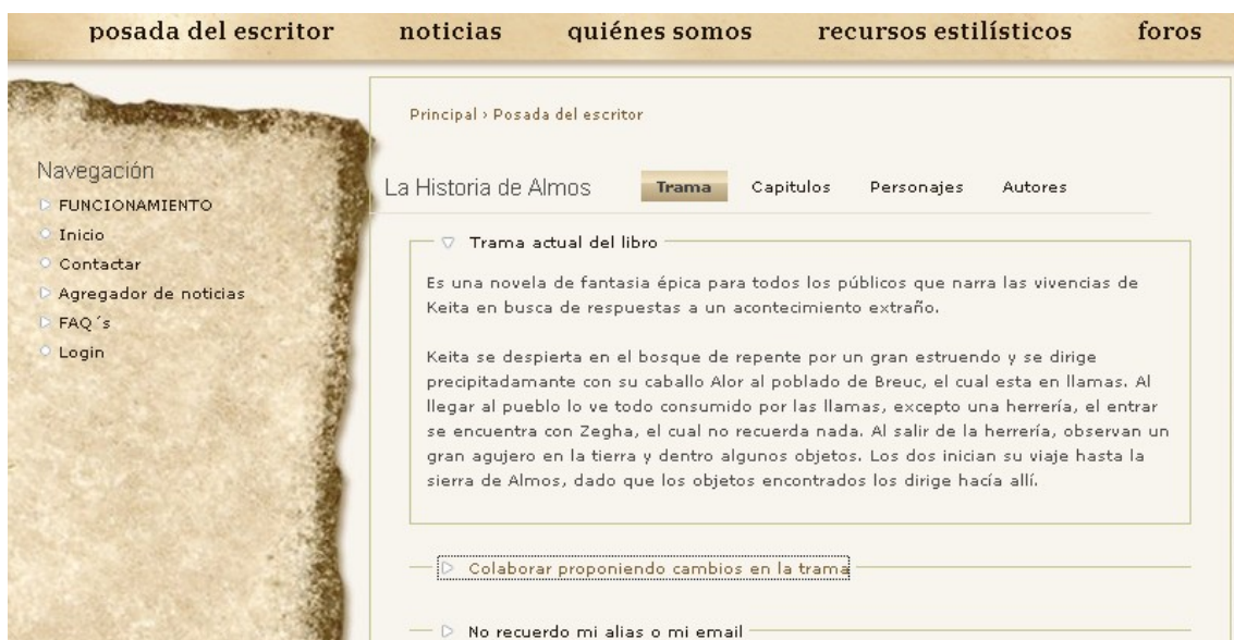
fig. 4: Sección trama

A nosotros nos interesa el menú Tramas , por lo tanto, accedemos dentro de este menú situando el ratón encima y presionando el botón izquierdo del ratón, de esta forma, accederemos a la página () donde se hace una descripción de la trama que actualmente se han usado en el libro.