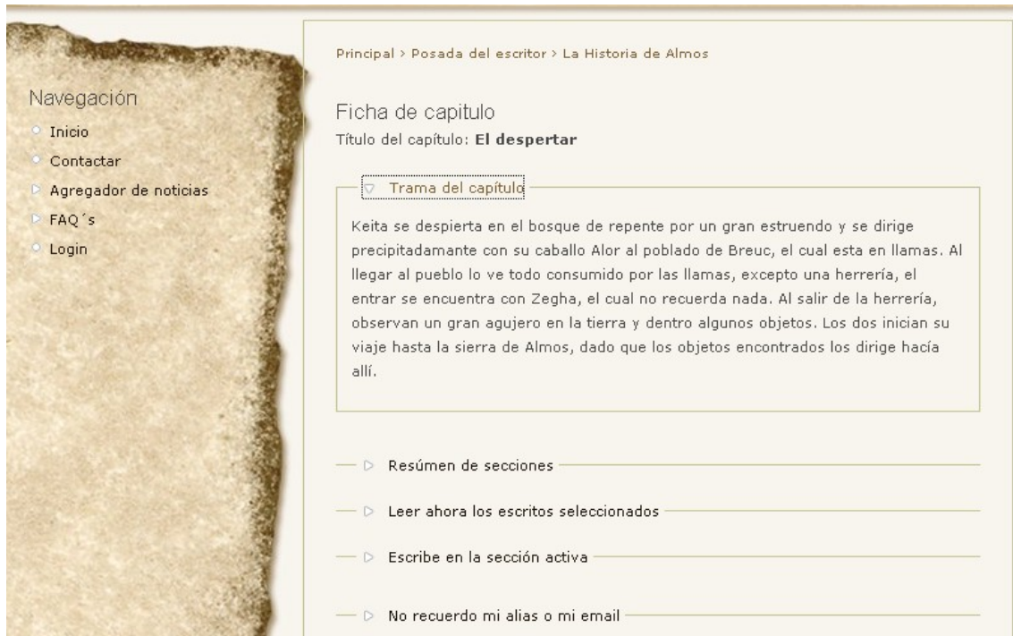
fig. 4: Ficha del Capítulo

Si situamos el ratón encima de Escribe en la sección activa se nos abre esta sección fig. 5 (puede que este abierta al entrar).