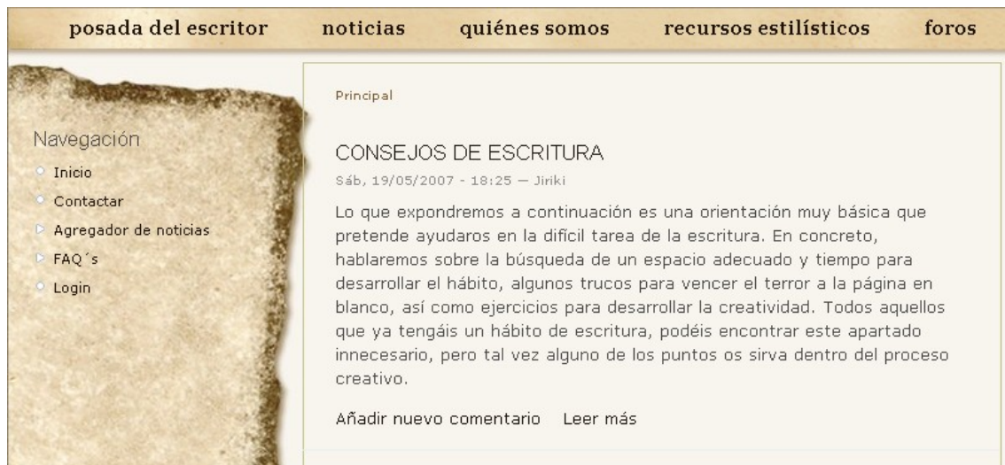
fig. 1: Página de inicio.

En la página de United minds, aparecen en la zona superior ( fig. 2 ), los menús para poder acceder a la zona de colaboración como escritor.