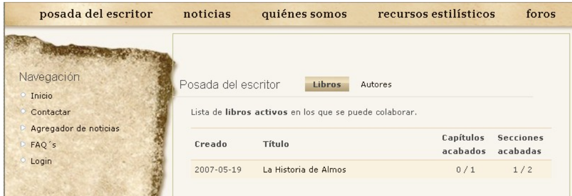
fig. 2: Menús superiores.

Una vez estamos en la página donde se encuentran los libros que hay activos (fig. 2), podemos seleccionar el libro en el que nos interesa participar, en este caso La Historia de Almos .